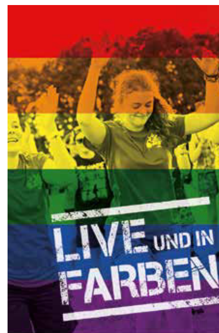
Landesjugendcamp 2022. Plakat: BKT