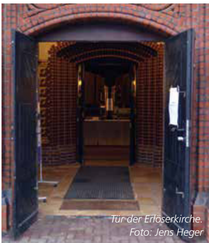
Tür der Erlöserkirche.

Vom Montag, den 11. April bis Gründonnerstag, den 14. April ist die Erlöserkirche jeweils von 15 bis 18 Uhr geöffnet. Alle sind eingeladen zu einem Moment der Stille oder zu einem Gebet. Manche möchten vielleicht einen Zettel mit einem Anliegen beschriften und ihn dann in unsere Gebetswand neben dem Seitenausgang stecken. Am Ostersonntag werden die Zettel dann in einem kleinen Osterfeuer vor dem Gottesdienst verbrannt.