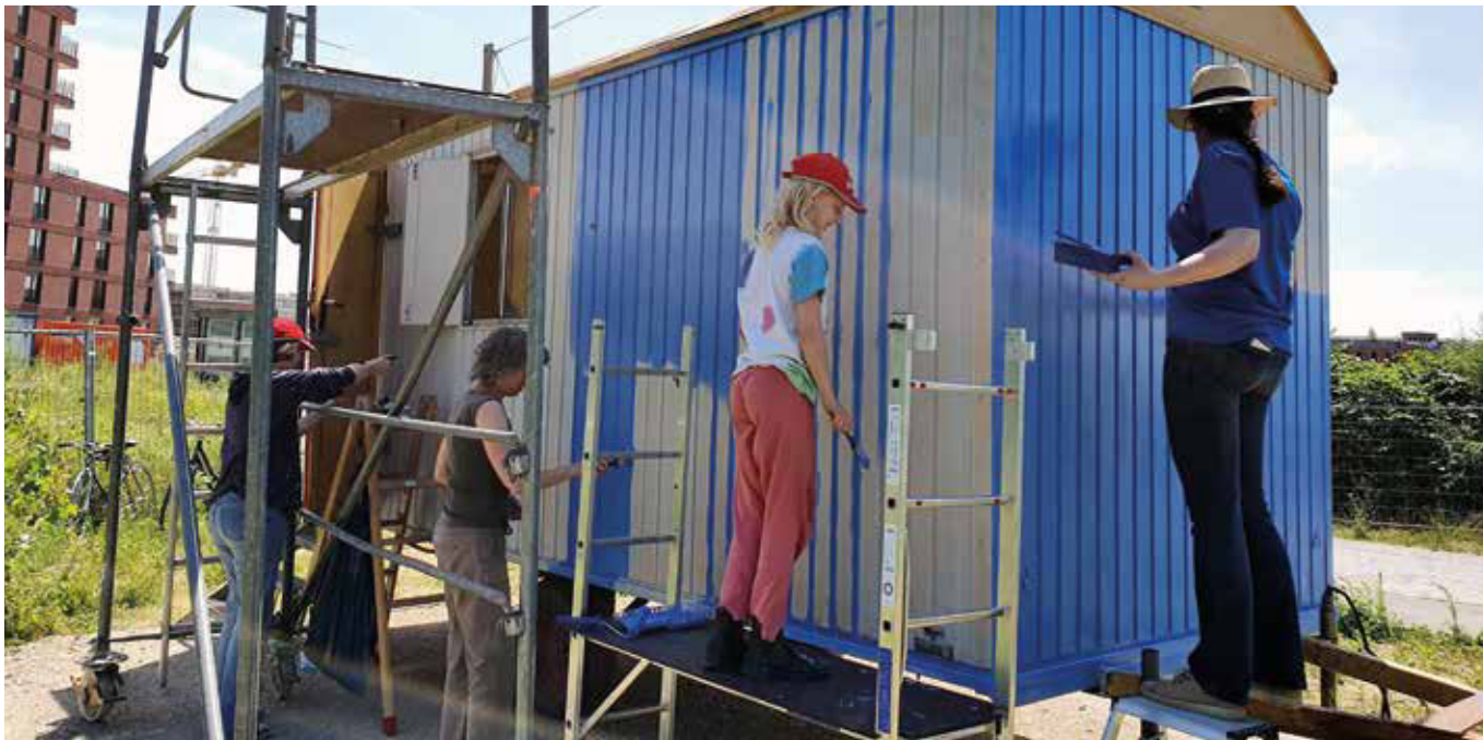
Wir gestalten unseren Bauwagen – Beheimatung ganz praktisch.

Unsere Welt verändert sich stetig. So auch das, was wir als Heimat bezeichnen.