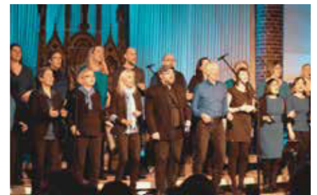
Offenes Singen 2022.

Mittlerweile weit über die Grenzen Hannovers bekannt: Am 1. und 3. Mittwoch im Monat laden wir um 19.30 Uhr zum offenen Singen ein.