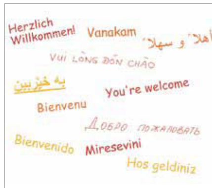
Screenshot der Website www.kinderoase-linden.de

Für die neuen Kinder sind die Gruppe, die Kinder und das Spielzeug im Vordergrund – auch wenn der Rucksack mit einem leckeren Snack gefüllt ist.