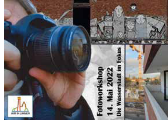
Fotoworkshop . 14. Mai 2022