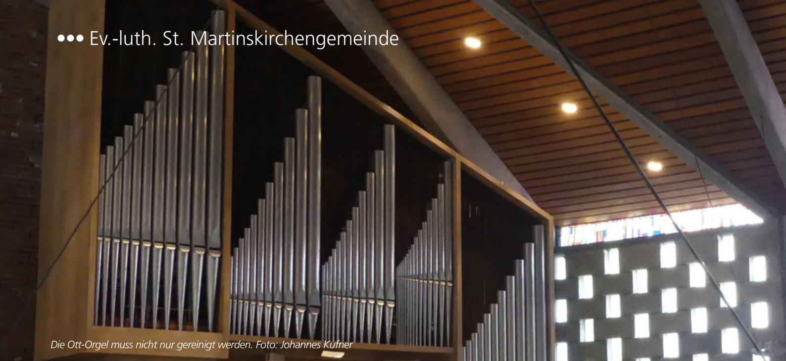
Die Ott-Orgel muss nicht nur gereinigt werden.