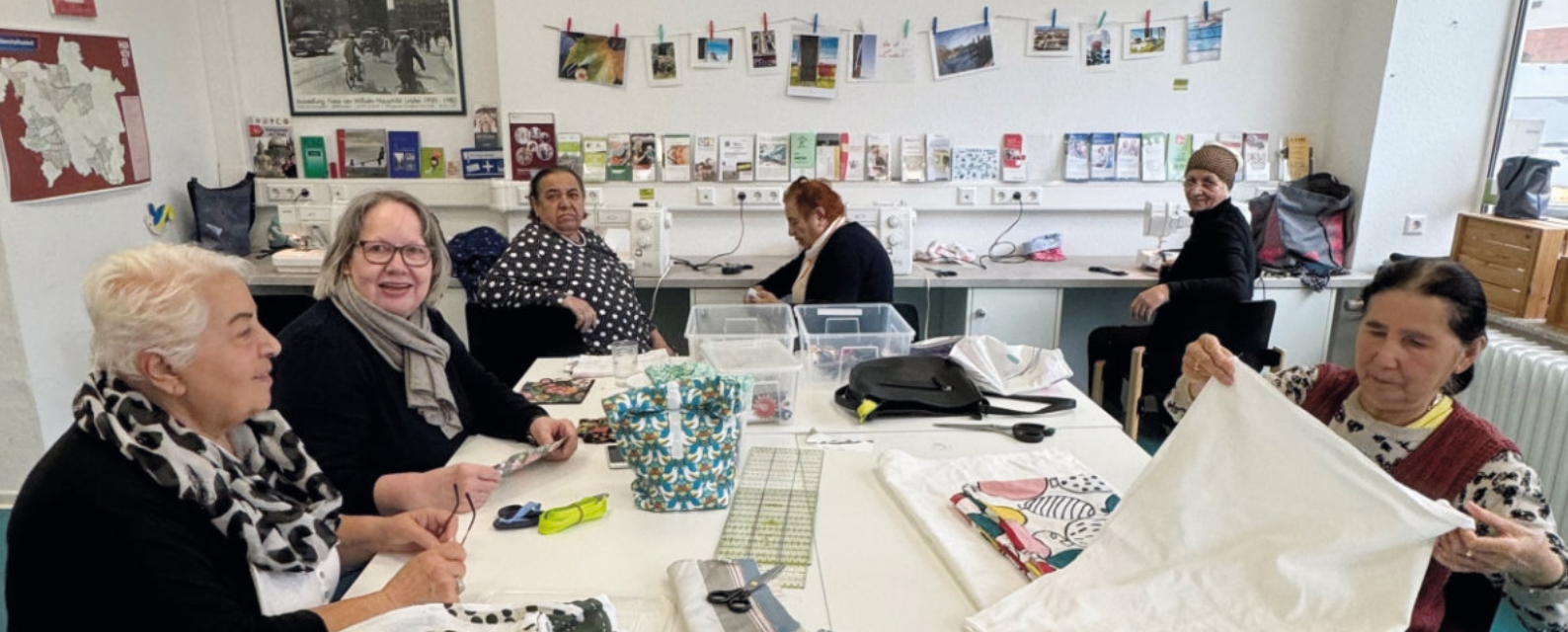
Immer freitags treffen sich Frauen zu einem Nähtreff im Sozial-Center.