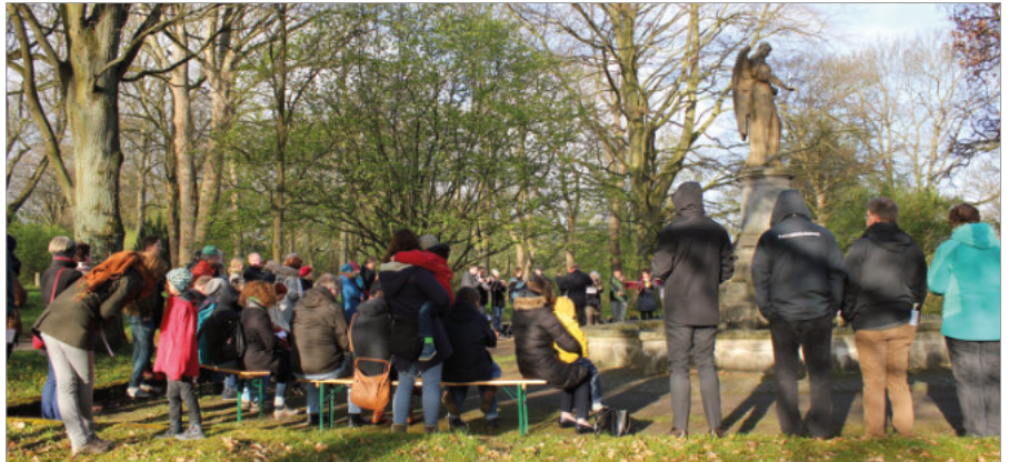
Bergfriedhof Ostergottesdienst.