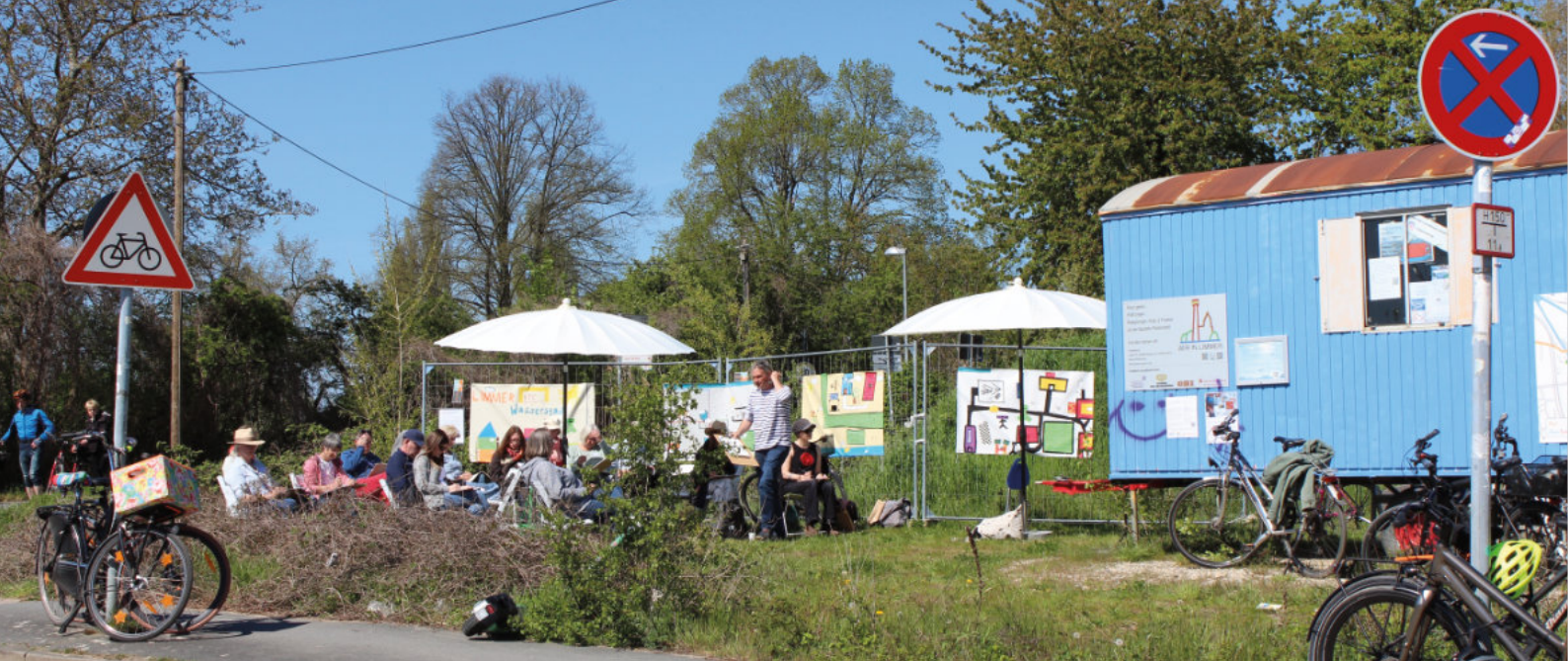
Buntes Treiben am Bauwagen.