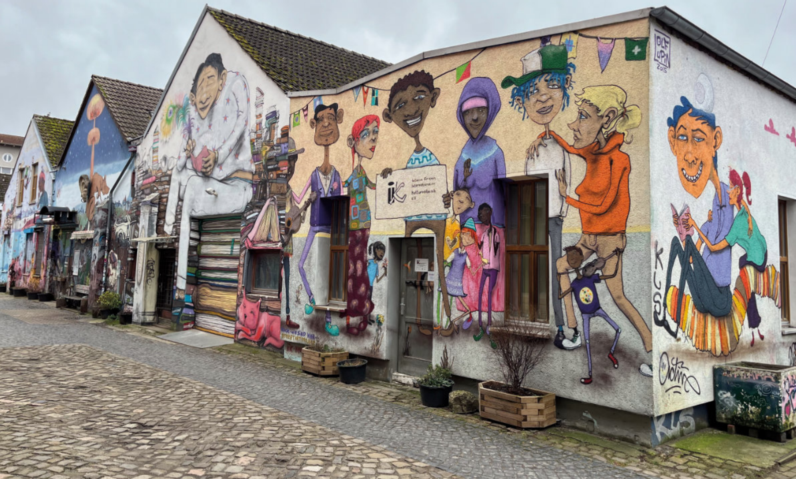
Die bunten Häuser auf dem Faust-Gelände